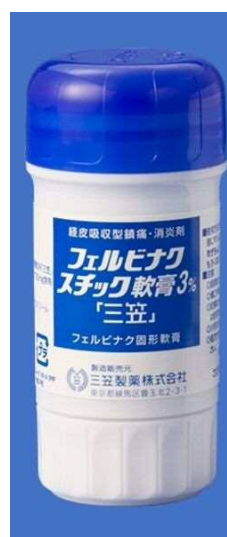
『フェルビナクスチック軟膏3%「三笠」』