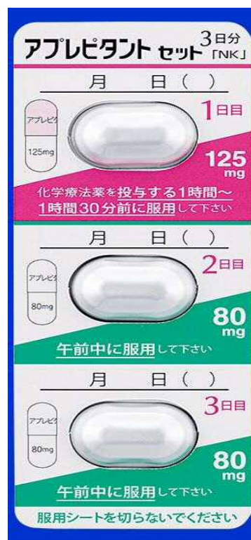
【アプレピタントカプセルセット「NK」】