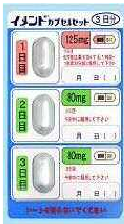
【イメンドカプセルセット】

選択的NK1受容体拮抗型制吐剤「イメンドカプセルセット」(小野薬品)は在庫が消耗し次第、「アプレピタントカプセルセット(NK)」(日本化薬)に切り替えを行います。