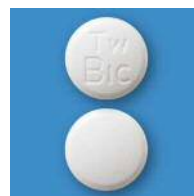
【ビカルタミド OD錠 80mg 「トーワ」】