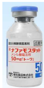
【ナファモスタットメシル塩酸注射用 50mg「トワ」】