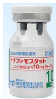
【ナファモスタットメシル塩酸注射用10mg「トワ」】