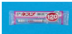
【ネスプ 120 \mu g シリンジ】