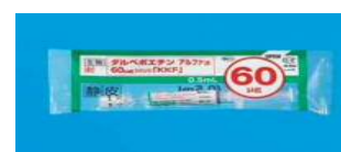
【ダルベポエチンアルファ注 60 \mu g シリンジ「KKF」】