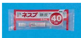
【ネスプ 40 \mu g シリンジ】