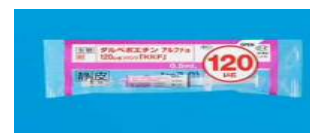
【ダルベポエチンアルファ注 120 \mu g シリンジ「KKF」】