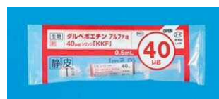
【ダルベポエチンアルファ注 40 \mu g シリンジ「KKF」】