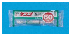
【ネスプ 60 \mu g シリンジ】