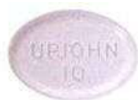
【ハルシオン 0.125mg 錠】