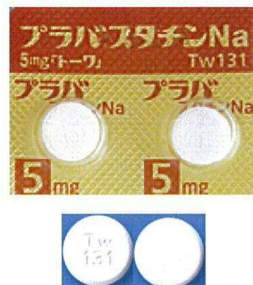
【プラバスタチン Na 錠5mg「トワ」】